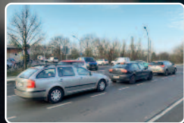
Rückstau von der Rudolf-Rühl-Allee