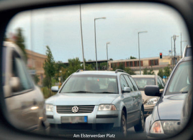
Am Elsterwerdaer Platz