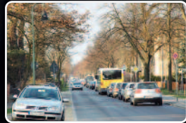
Auf der Köpenicker Straße